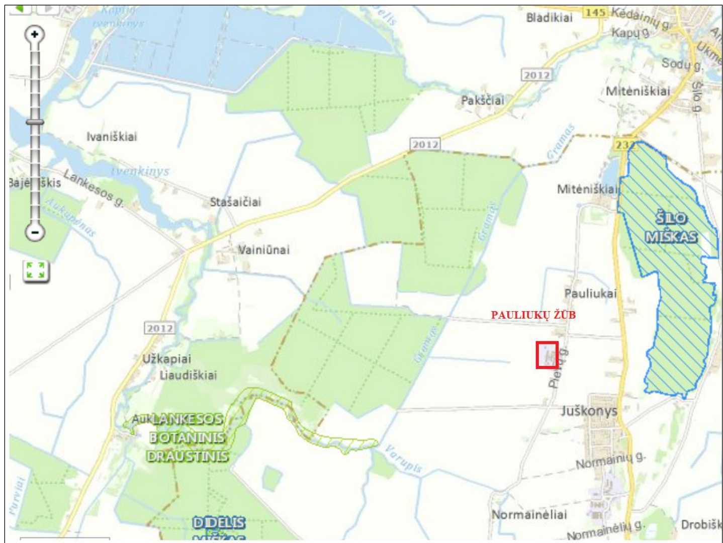
Pav. 3. Ūkinės veiklos vieta saugomų teritorijų atžvilgiu (informacijos šaltinis: http://stk.vstt.lt )